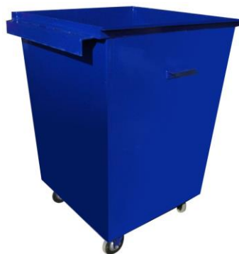
Доработанный под заднюю загрузку (с приваренным швеллером и колесами)